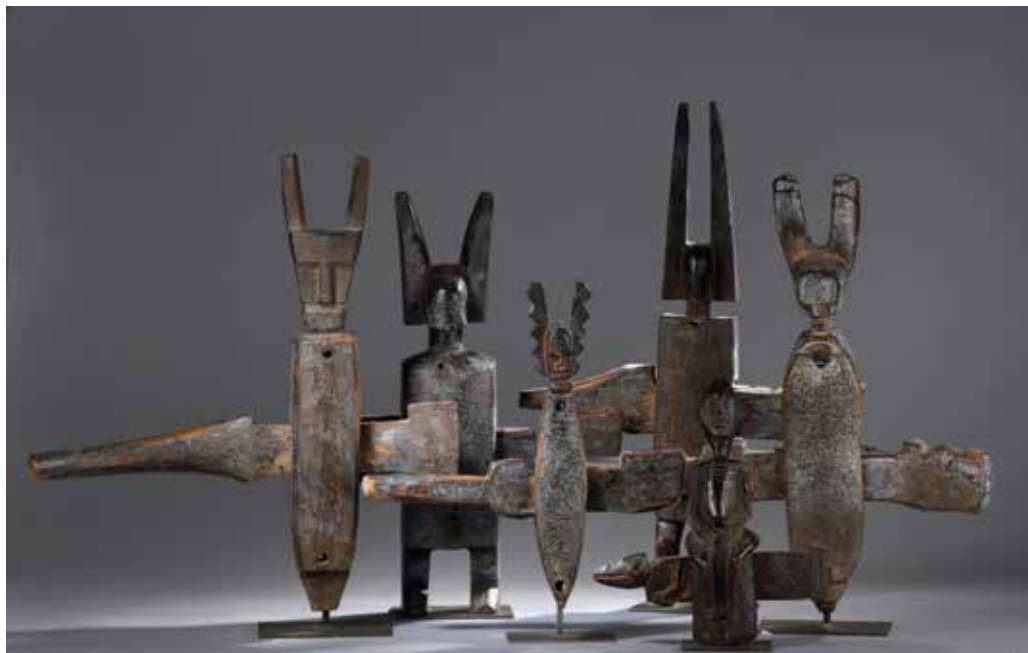
209 et 210